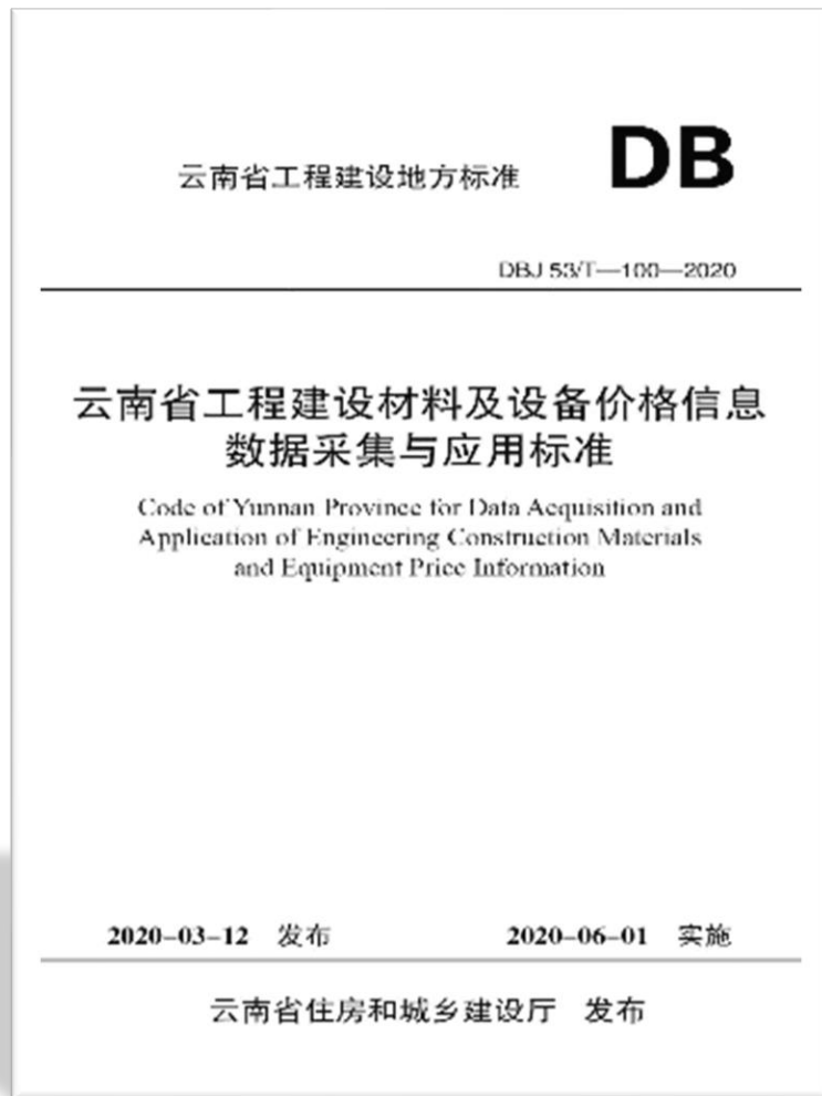
《云南省工程建设材料及设备价格信息数据采集与应用标准》