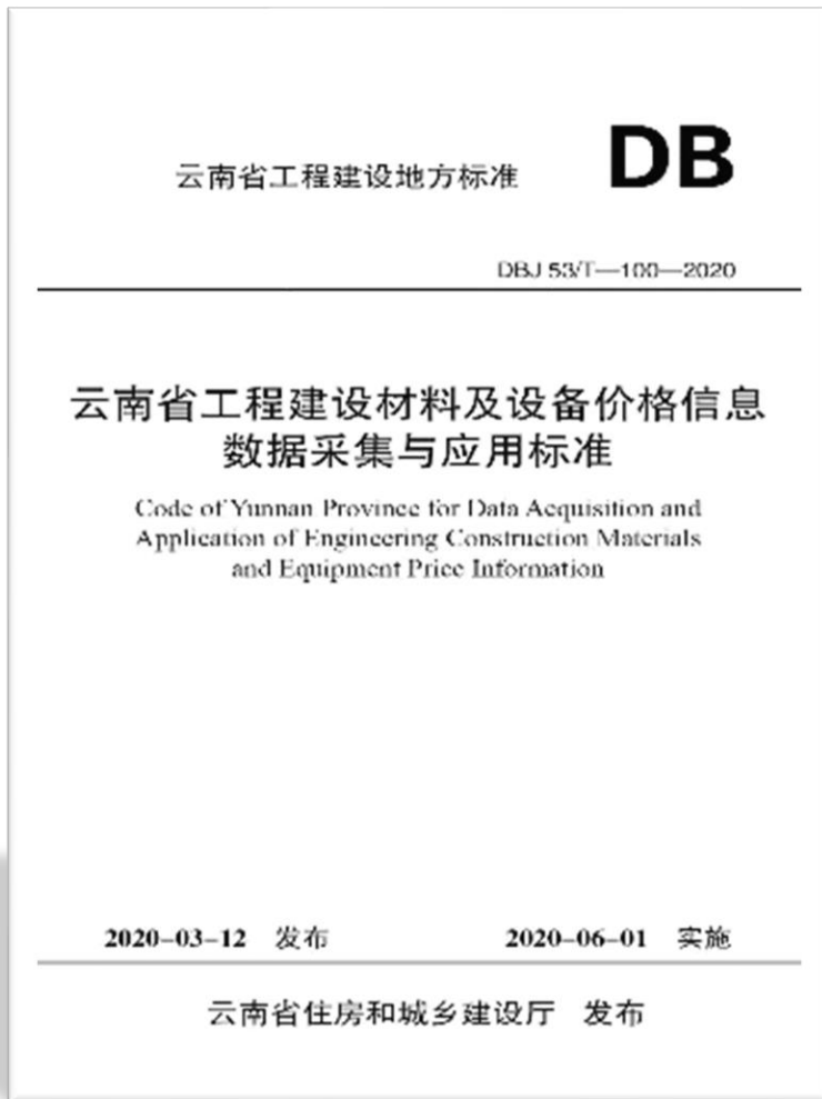
《云南省工程建设材料及设备价格信息数据采集与应用标准》

★ 为了促进云南省价格信息编制工作的准确性和统一性，便于全省价格信息的统一测算并最终在监测平台上呈现，自2020年6月起开始实施《云南省工程建设材料及设备价格信息数据采集与应用标准》。