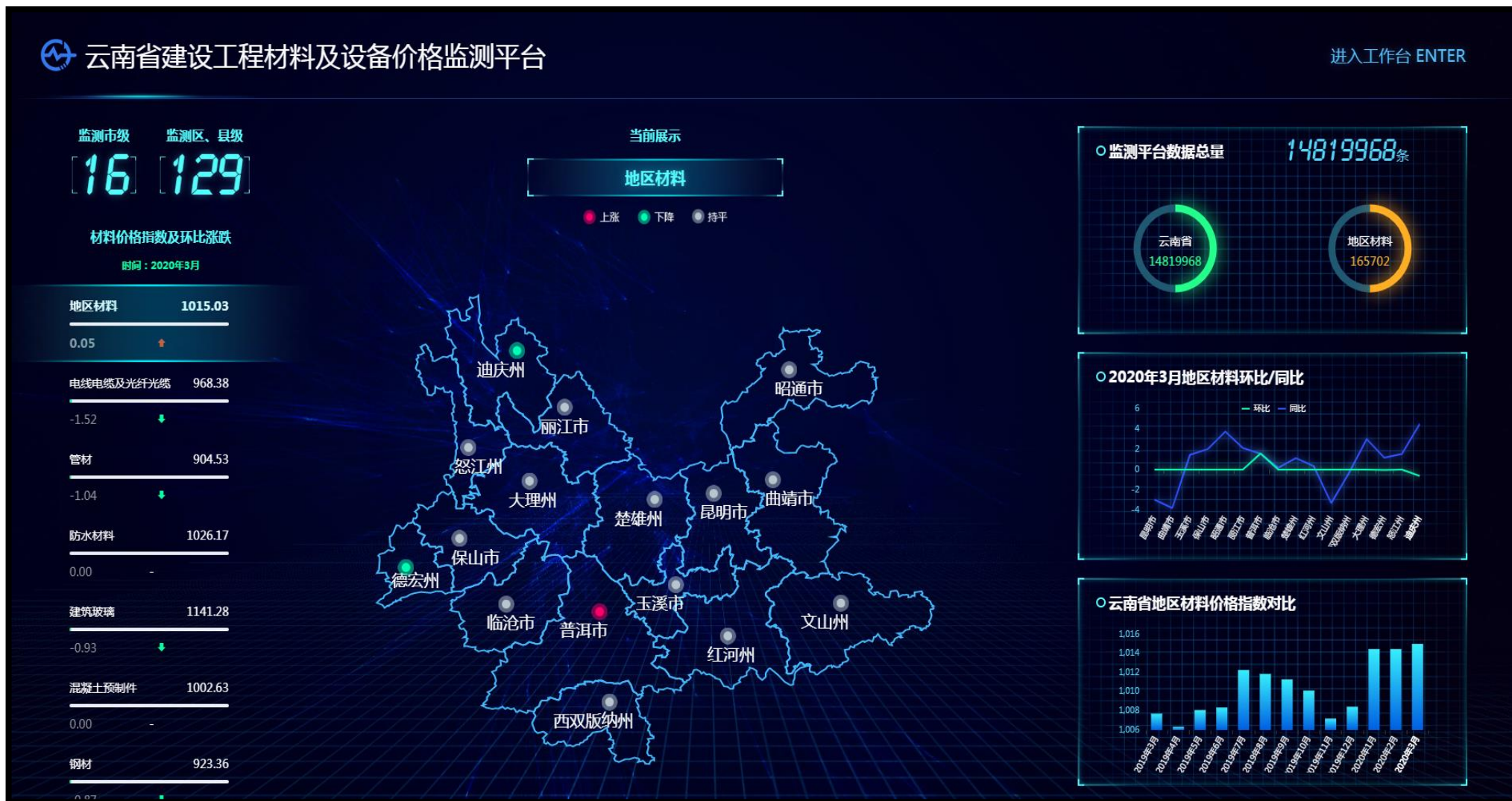
云南省建设工程材料及设备价格监测平台